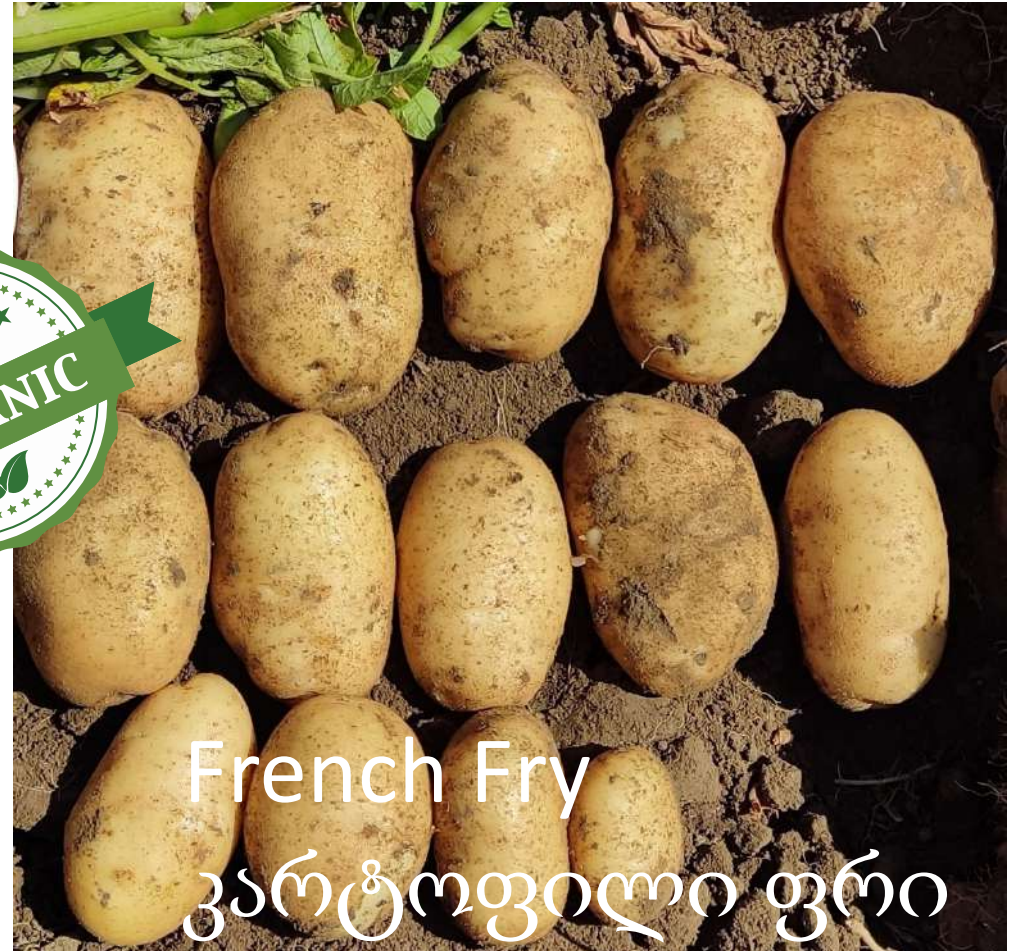
French Fry კარტოფილი ფრი