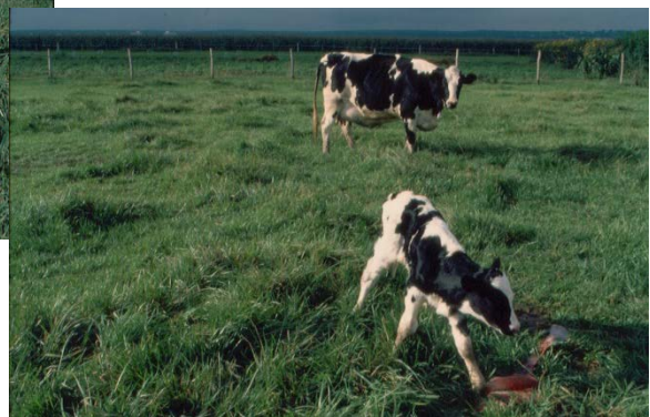
P. Pulvery BTIA-ის ფოტოები